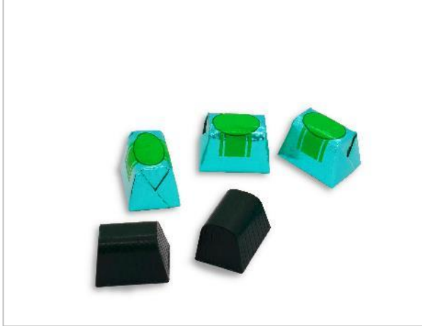
Bild 2: Auf dem ProSweets-Messestand demonstriert Theegarten-Pactec die CHS mit der neu integrierten Faltart Brieffaltung. Mit dieser werden beispielsweise kleine Schokoladenpralinen künftig mit einer Leistung von bis zu 1.600 Produkten pro Minute verpackt.